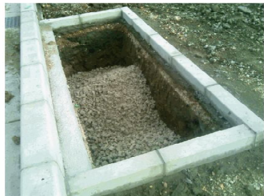
スーパーソル投入状況