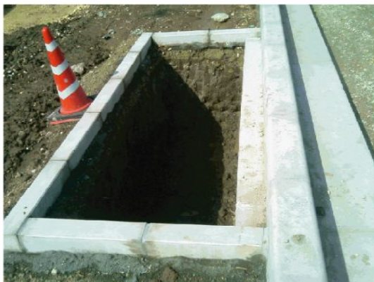
スーパーソル投入前