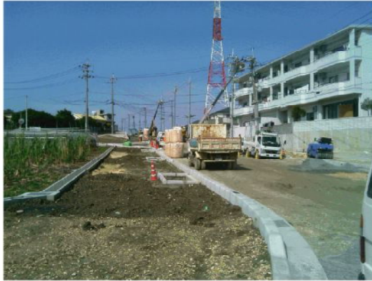
スーパーソル納品状況