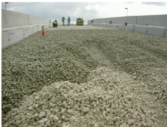
▲敷き均し転圧状況