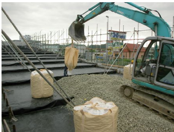
▲スーパーソル投入状況