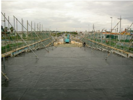
▲スーパーソル投入前