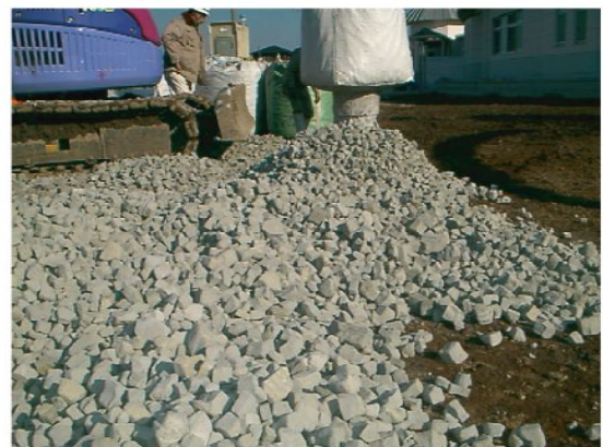
◆スーパーソル敷き設状況①