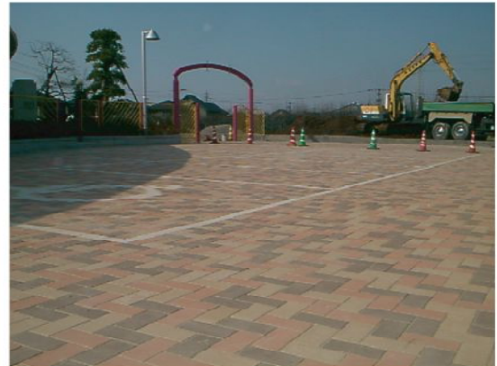
◆運動施設完成写真