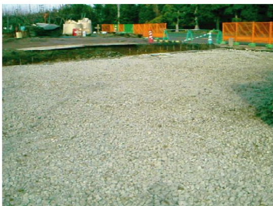
◆スーパーソル敷き設状況②