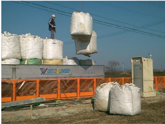
◆スーパーソル搬入