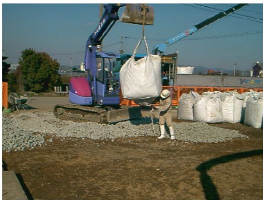
◆スーパーソル投入状況