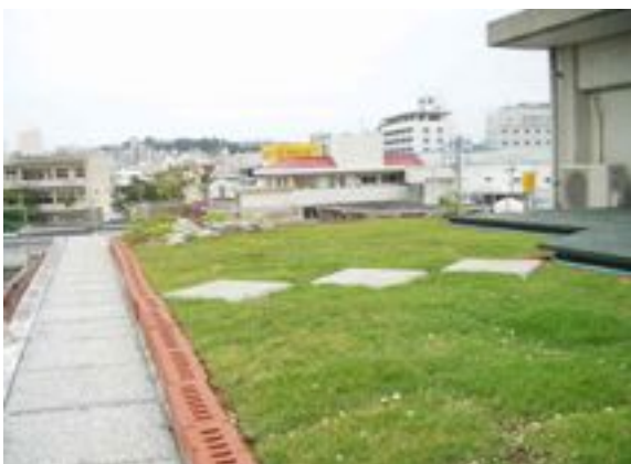
▲サンガードの上に芝張り