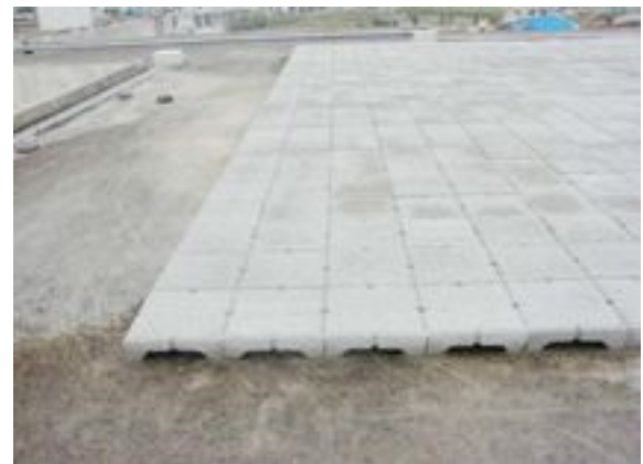
▲スーパーソルサンガードを敷設